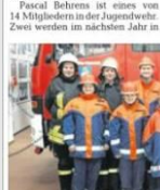
Die Jugendabteilung der Freiwilligen Feuerwehr Kriebitz wünscht sich ein Gruppenzelt fürs Zeltlager und einheitliche Shirts.

Bad Doberan. Sie gewährleisten den Brandschutz für die Zukunft, werden in einigen Jahren Unfälle abwehren und Hilfe leisten: Rund 250 Kinder und Jugendliche engagieren sich in den 22 Jugendabteilungen der freiwilligen Feuerwehren zwischen Nienhagen, Kuhlungsborn, Neubukow und Bad Doberan. Doch dem Löschnachwuchs fehlt es vor allem für die dunkleren Jahreszeiten an passender Kleidung. Sie benötigen Ausbildungsmaterial wie Brandschutzkoffer und Reanimationsgruppen. Mit der Weihnachtsaktion „Helfen bringt Freude“ sammelt die OZSEE-ZELTUNG in diesem Jahr Spenden für die Nachwuchskräfte.